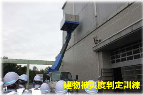
建物被災度判定訓練