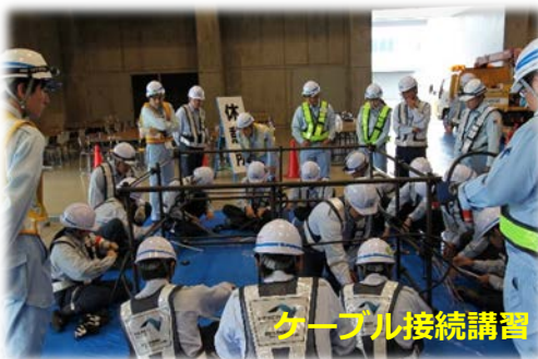
ケーブル接続講習