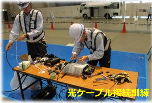
光ケーブル接続訓練