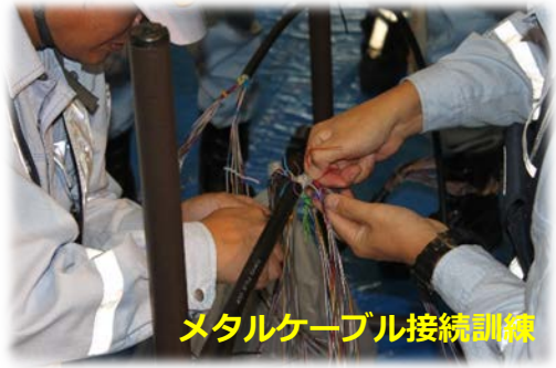
メタルケーブル接続訓練