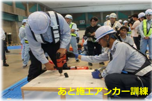
あと施工アンカー訓練